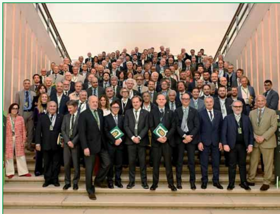
Presidenti, direttori e dirigenti di Confagricoltura