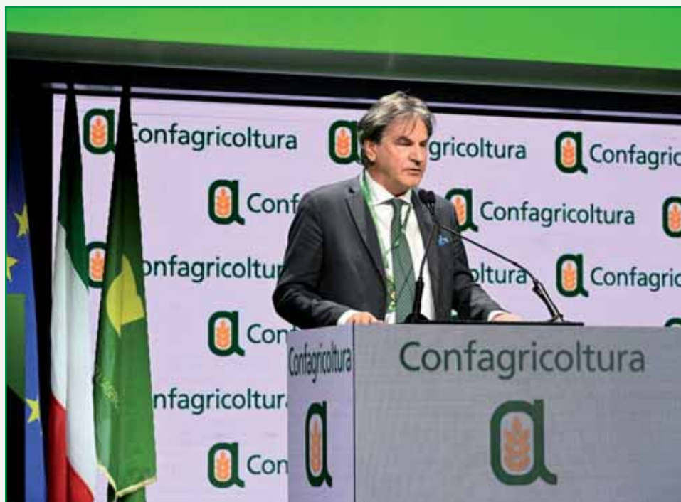
Roberto Caponi, direttore generale di Confagricoltura.

"Ben venga la valorizzazione della contrattazione collettiva leader - cioè quella stipulata dalle organizzazioni comparativamente più rappresentative sul piano nazionale - per l'individuazione del salario giusto. È importante che la definizione degli elementi che compongono il salario giusto sia frutto della fase di contrattazione e non una previsione di legge". Questa la posizione espressa da Roberto Caponi , direttore generale di Confagricoltura , in commissione lavoro della Camera. "Riguardo alla definizione del salario giusto - evidenza Caponi - Confagricoltura chiede che, in fase attuativa del decreto, si tenga conto delle specificità della contrattazione collettiva agricola, fortemente decen-