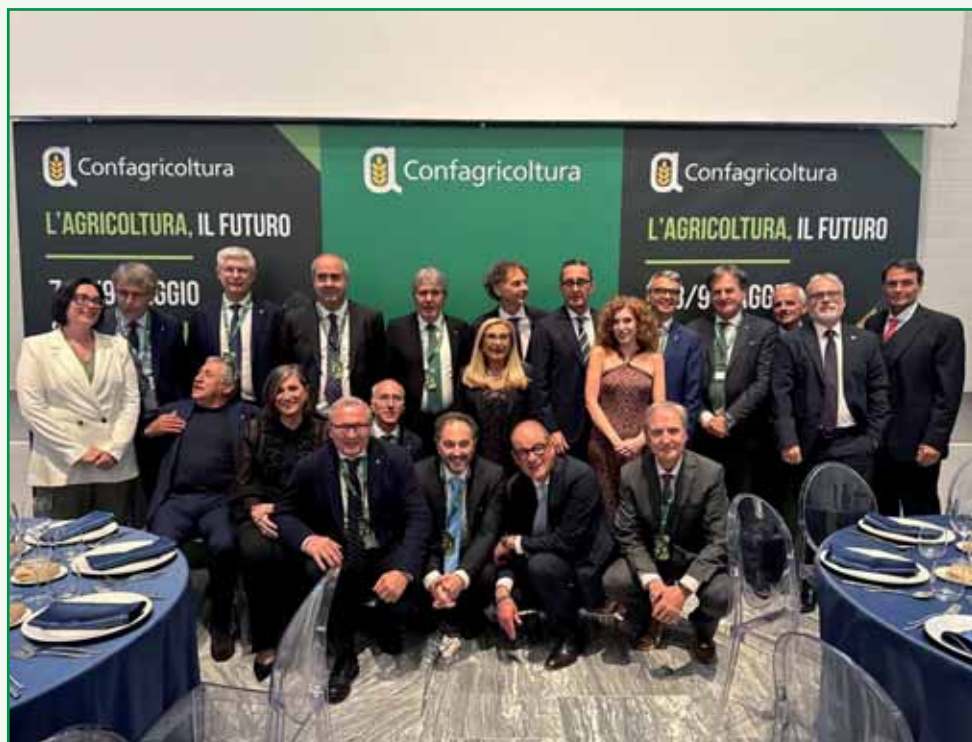
La delegazione di Confagricoltura Emilia-Romagna.