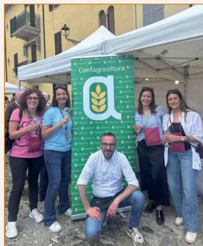
Cantine Cerdelli in festa con lo staff di Confagricoltura Parma.

APPROFITTA ORA DELLE DETRAZIONI FISCALI CON