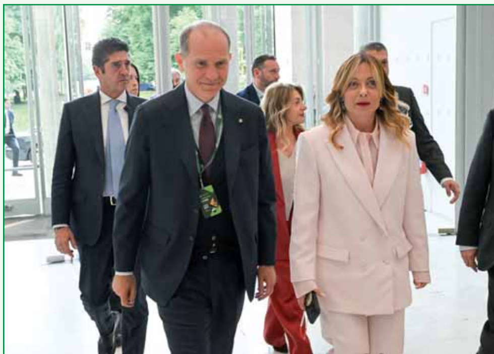
La premier Meloni al forum di Confagricoltura.

"Si avverte sempre di più la necessità di uscire da un paradigma che ha sempre visto l'agricoltura come semplice produttrice di beni primari essenziali" ha affermato il presidente nazionale di Confagricoltura Massimiliano Giansanti , sottolineando come sia necessario riconoscerne la "reale portata economica".