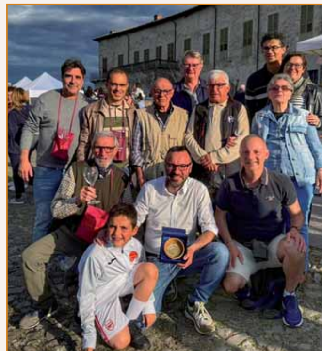
Cantine Cerdelli in festa.

L'evento è stato organizzato da ProLoco Sala Baganza insieme al Comune di Sala Baganza, con il supporto del Consorzio Vini Colli di Parma. All'inaugurazione sono intervenuti anche l'assessore regionale Massimo Fabi ; la vicepresidente dell'assemblea legislativa dell'Emilia Romagna, Barbara Lori e il consigliere provinciale Fabio Bonatti .