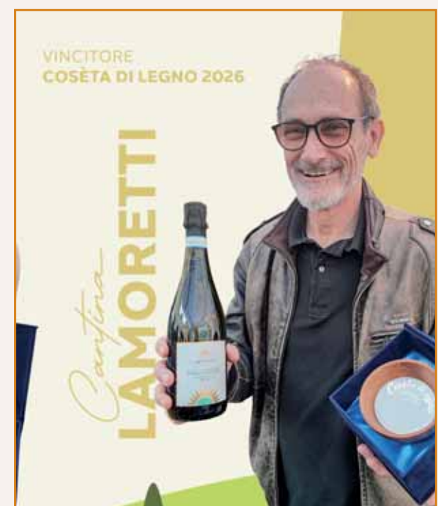
Cantine Lamoretti, vincitore Cosèta di legno.