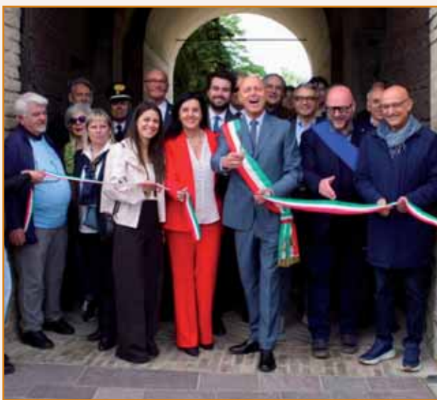
Il taglio del nastro.

Al Festival della Malvasia 2026 erano presenti le principali realtà produttive del territorio: Azienda Agricola Lamoretti, Cantine Cerdelli, Cantine Moroni Zucchi, Azienda Agricola Salati Egidio, Cantina Oinoe, Antica Cantina Parmigiana, Cantina Il Poggio, Azienda Agricola Palazzo, Amadei Vini, Azienda Agricola Scartazza, La Bandina Vini e Le Antighe.