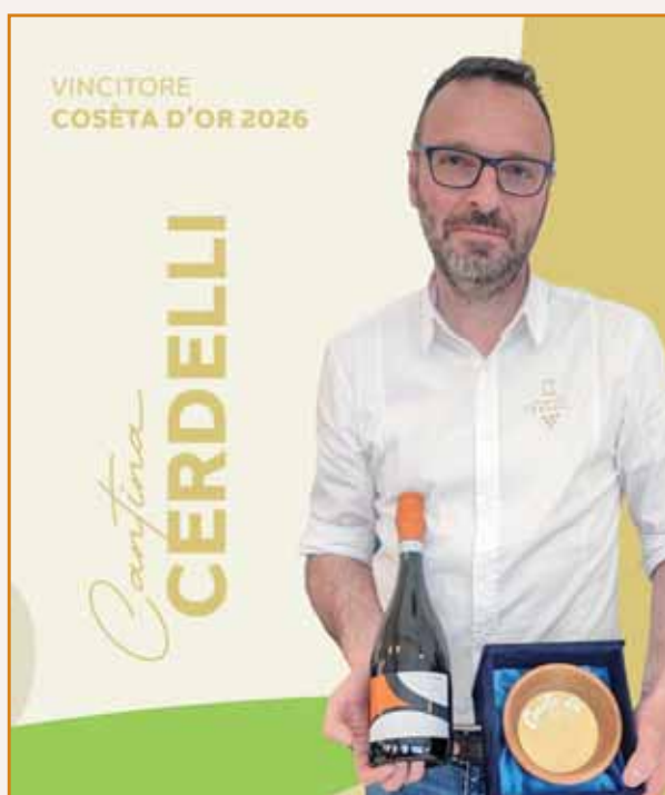
Cantine Cerdelli, vincitore Cosèta d'or.