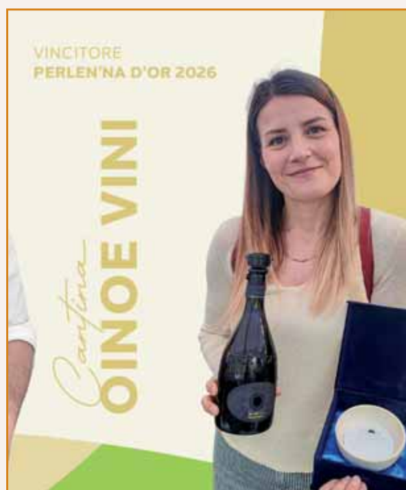
Oinoe vini, vincitore Perlen'na d'or.