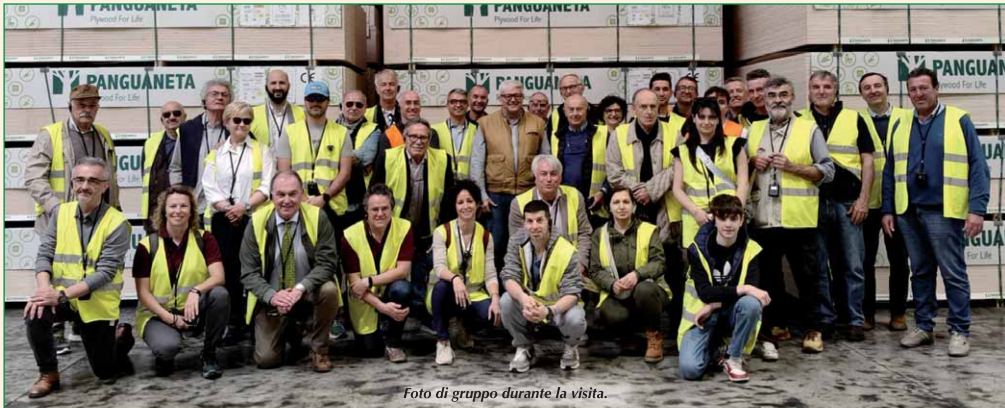
Foto di gruppo durante la visita.

Associazione pioppicoltori in visita all'azienda Panguaneta