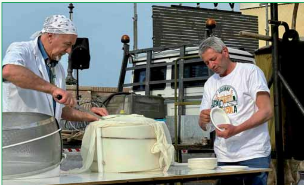
Casari al lavoro.