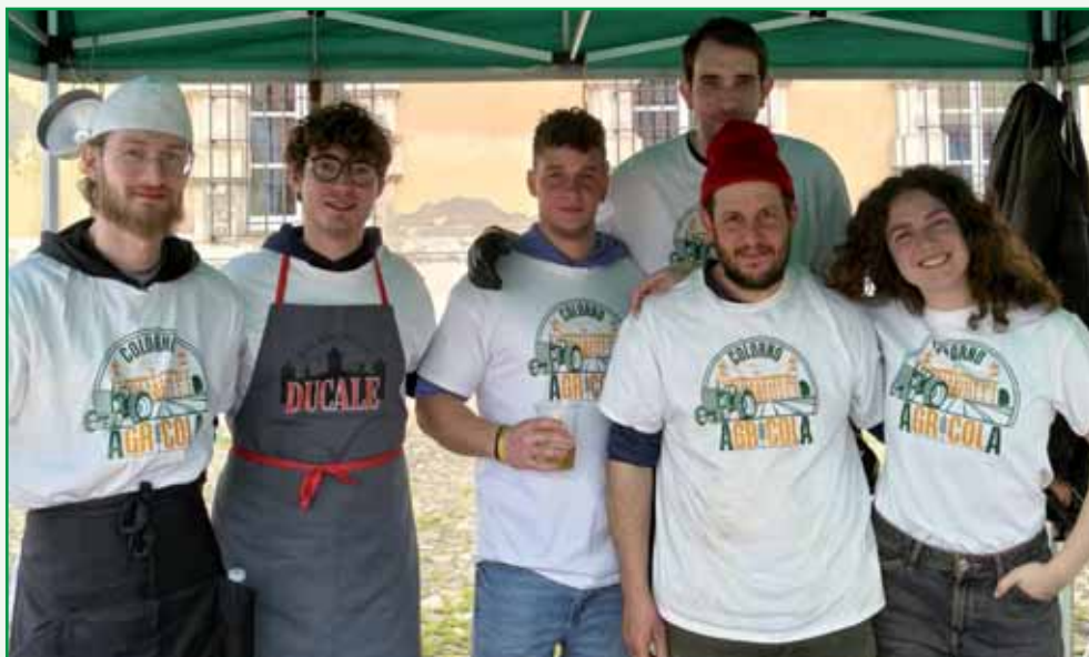
Un gruppo di ragazzi di Colorno Agricola.