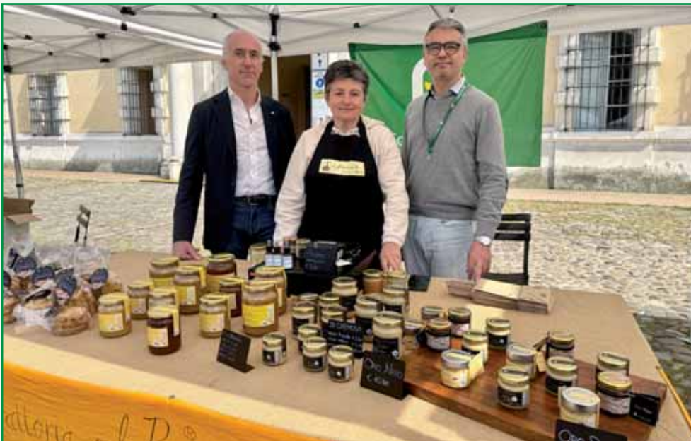
La fattoria sul Po di Barbara Alberti.