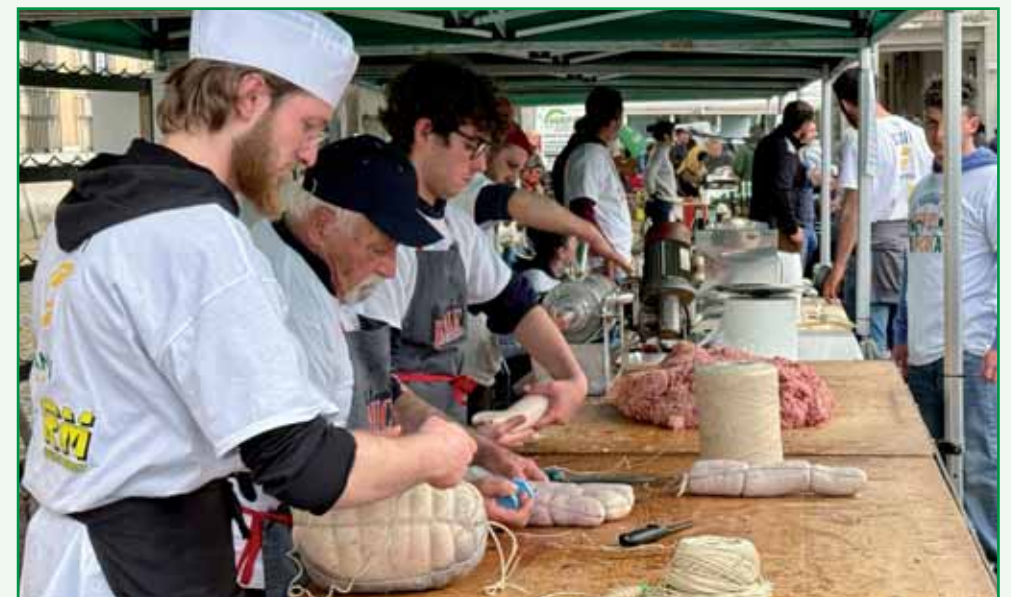
Lavorazione delle carni.