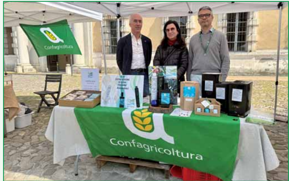
Azienda agricola Giulio Del Monte.