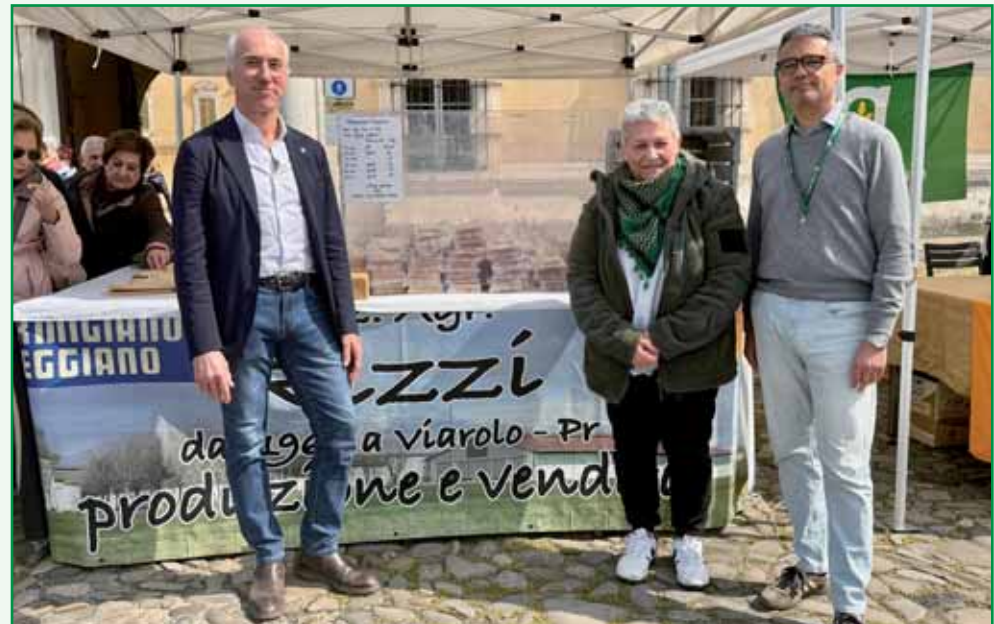
Azienda agricola Rizzi.