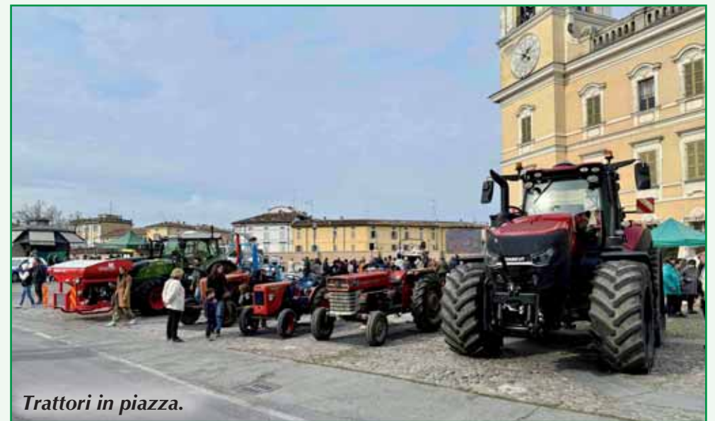
Trattori in piazza.