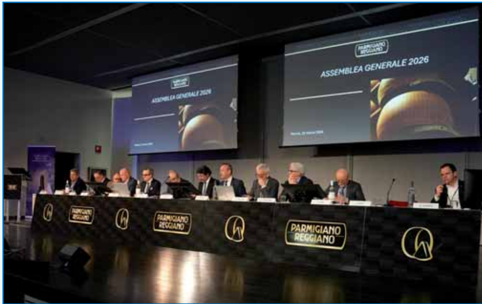
Un momento dell'assemblea del Consorzio del parmigiano reggiano.

L'Assemblea generale dei consorziati del Parmigiano Reggiano , tenutasi il 25 marzo all' Auditorium Paganini di Parma , ha approvato con il 100% dei consensi il bilancio consuntivo 2025, che si è chiuso con un utile di esercizio di 192.679 euro (vs. 158.447 nel 2024): il totale ricavi è stato di 59.787.137 euro a fronte di un totale costi di 59.267.944 euro.