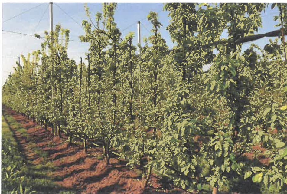
Esempio di corretta gestione del sottofila.