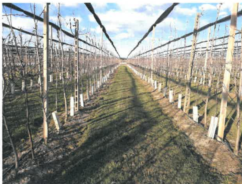
Esempio di cotico erboso correttamente sfalcio.

In sintesi, un'accortezza fondamentale resta quella di ridurre la quantità di materiale vegetale secco proveniente dal prato per ostacolare la moltiplicazione del fungo.