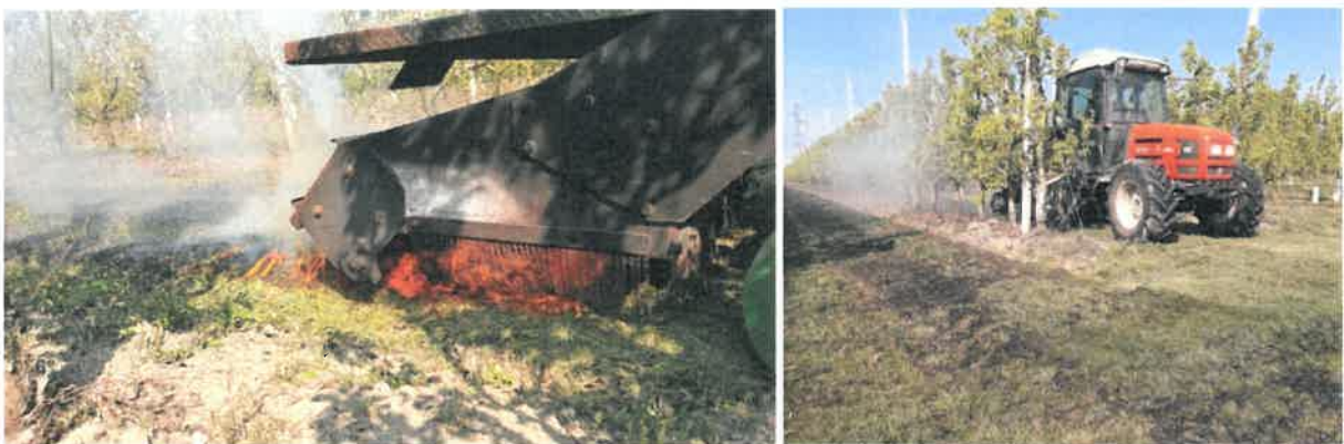
Esempio di trattamento termico con pirodiserbo su prato recentemente sfalcio.

La tecnica non è di facile applicazione e non si adatta a tutti gli impianti (possibili criticità rappresentate da ali gocciolanti o materiale infiammabile).