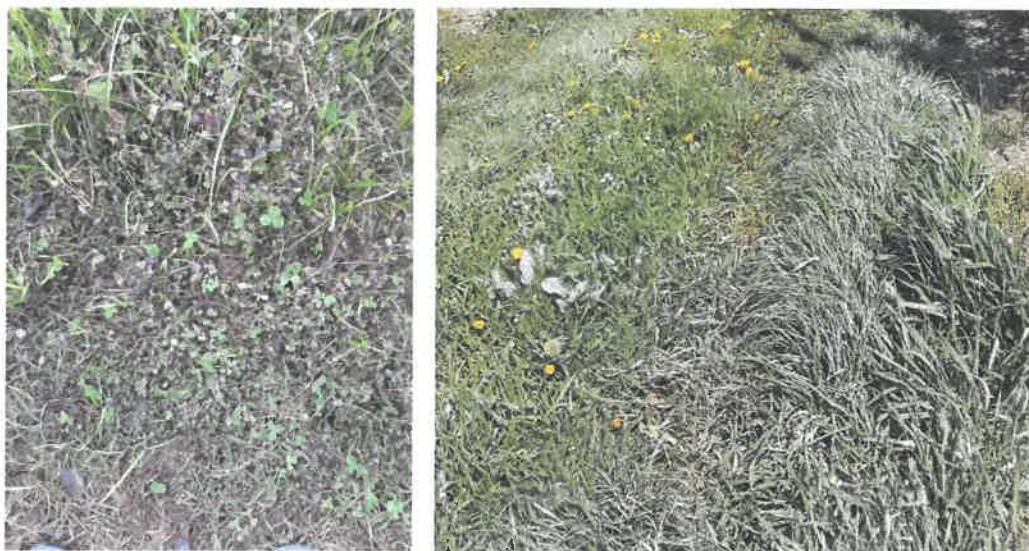
Esempio dell'effetto dei trattamenti con prodotti sanificanti al cotico erboso.

L'attività è destinata a stemperarsi/diminuire nel tempo, anche in funzione dell'andamento meteorologico. È quindi opportuno, in condizioni di rischio, reiterare gli interventi durante la stagione per prolungarne gli effetti benefici.